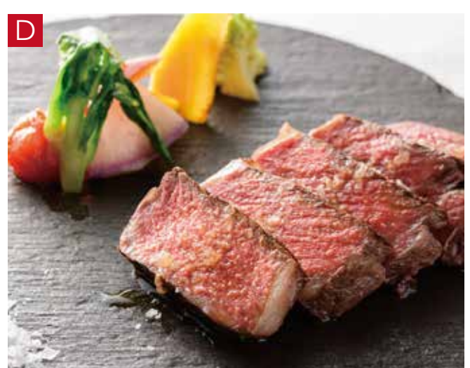
D 国産牛フィレ肉のグリル 彩り野菜と黒トリュフのソース