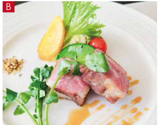
B 那須高原豚のグリル シェリービネガーのソース

Sautéed Fresh fish in Salmorillo sauce with Green pepper