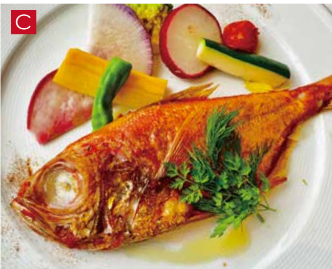
C 数量限定 三崎漁港直送 丸ごと一本魚の香草オーブン焼き