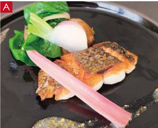
A 相模湾直送鮮魚のソテー グリーンペッパーを使ったサルモリッリョソース